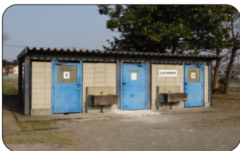
老朽化が目立つ学校の社会体育トイレ

社会体育トイレの洋式化につきましても多くの皆様にご利用される施設ですので、老朽化の程度を勘案しながら随時、検討して行きたいと考えています。