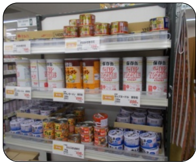
スーパーの非常食コーナー